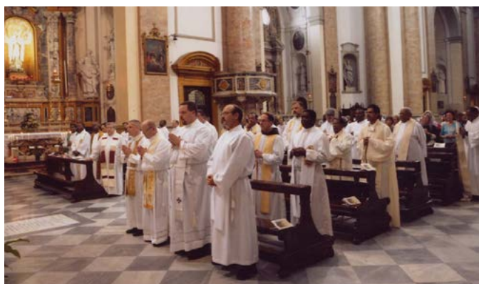
Een groep van meer dan 100 Amerikaanse priesters en bisschoppen die in 2006 op pelgrimstocht kwamen naar Rosa Mystica terwijl ze vierden in de kathedraal van Montichiari en in Fontanelle.

plaats in Rome: zonder voorbereiding, zonder speciale sprekers, vonden we broeders uit andere landen en wisselden we onze ervaringen uit, en het verlangen om een grote, wereldwijde bijeenkomst te organiseren werd steeds duidelijker.