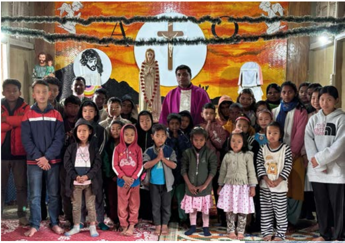
Rosa Mystica School in INDIA