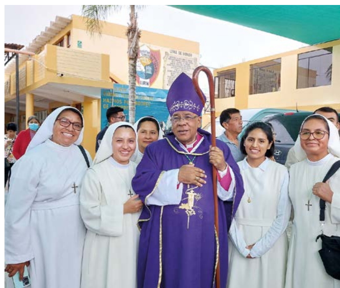
Zusters van Peru met de plaatselijke bisschop