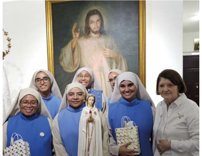
Panama - nieuwe orde van zusters opgericht met Rosa Mystica als naam.

ging van Montichiari en de diocesane bisschop uit. Dit Congres, dat van 9 tot 13 oktober van dat jaar in Panama werd gehouden, was beslist voorbestemd om het beginpunt te worden van een nauwe en effectieve samenwerking tussen de Kerk van Brescia en alle gelovigen van de Rosa Mystica in de wereld, mede dankzij de beschikbaarheid en openheid van Mgr. Marco Alba, die voor deze gelegenheid tot afgevaardigde van de bisschop