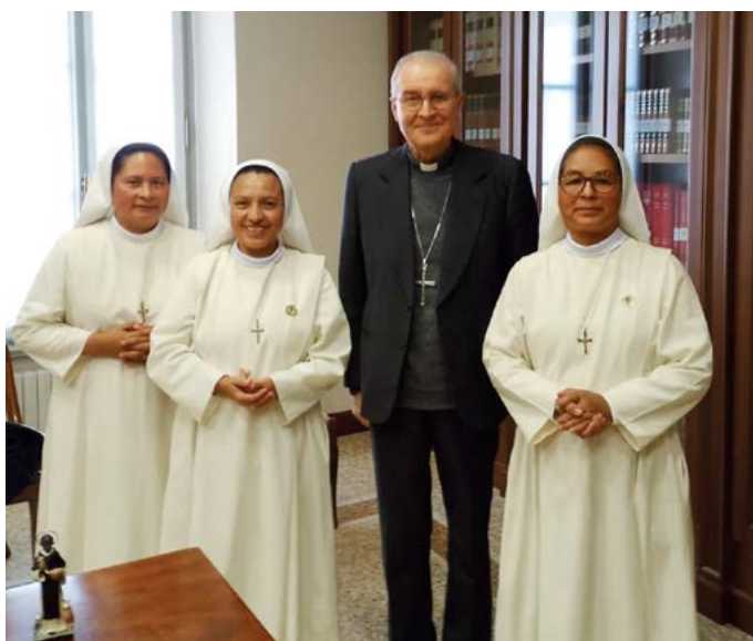
Zusters van Peru met de bisschop van Brescia