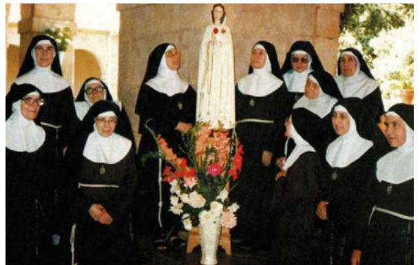
Gebedsgroep uit een Afrikaans land