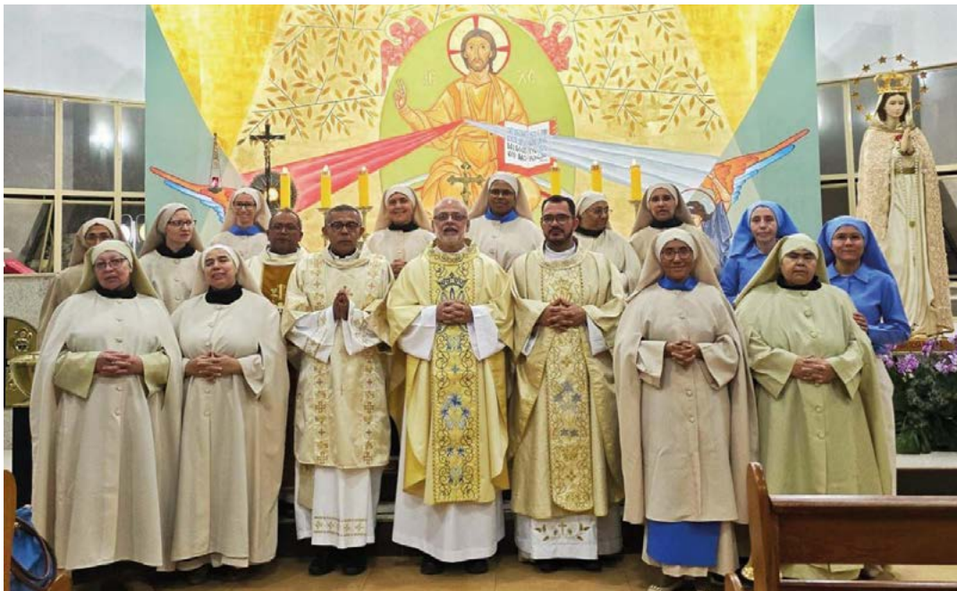
De kleine missionarissen van Maria Rosa Mystica: een gemeente die twintig jaar geleden in Brazilië is opgericht.