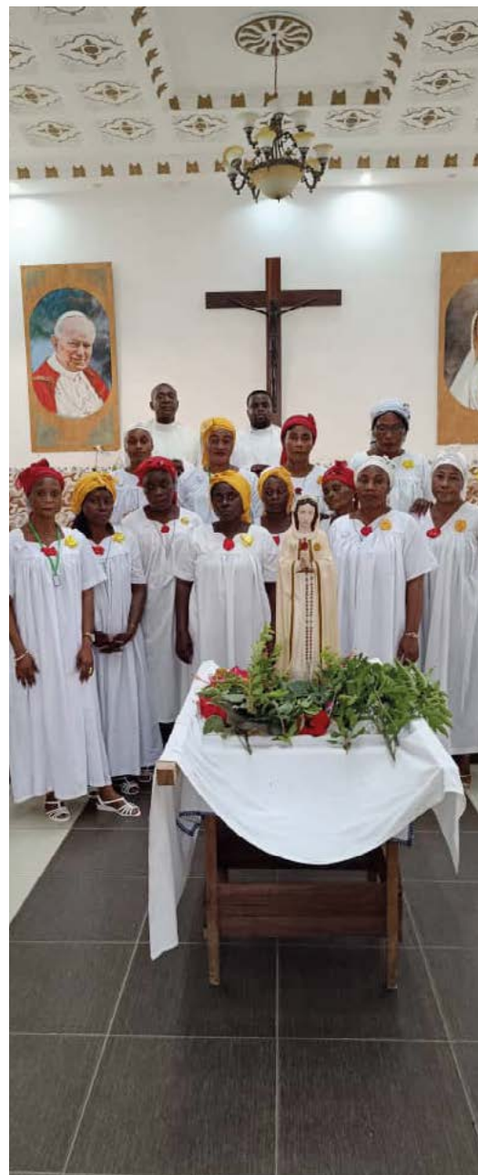
Sprekers uit Equatoriaal-Guinea